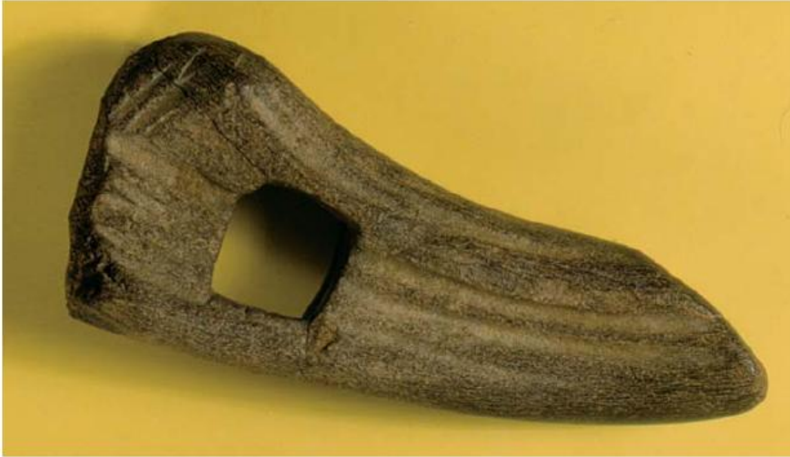
5 Bijl gemaakt van het gewei van een eland uit de brons- of ijzertijd, waarschijnlijk gebruikt om de bodem mee te bewerken.