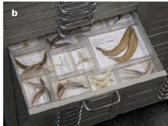
12a, b Vergelijkingscollectie van recente dieren: hier een vol scheenbeenderen van zoogdieren (a) en een vol botten van verschillende vissen (b).

Bij publicatie van resultaten moet worden aangegeven welke collecties bij de determinatie gebruikt zijn zodat een indruk wordt gegeven van de kwaliteit van de gebruikte infrastructuur.