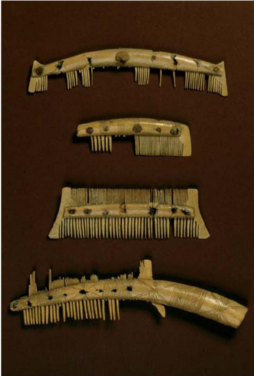
15 Tiende-eeuwse kammen van gewei uit de ringwalburg van Oost-Souburg.

Een systeem voor het vastleggen van hak-, snij-, schraap- en zaagsporen geeft de 'butchery mark code' van Lauwerier (1988). Onlangs zijn initiatieven gestart deze code uit te breiden en meer algemeen toepasbaar te maken. Diagrammen waarmee de sporen van snijden, hakken, schrapen, zagen en kapotslaan 'gedefinieerd' worden geven Reitz en Wing (2008, 129-132).