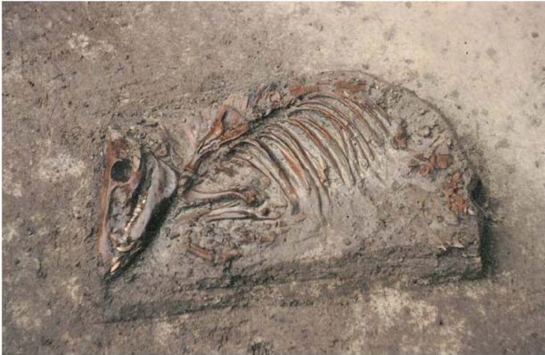
3 Het skelet van een dertiende-eeuws varken in een opgraving.

Archeozoölogie is grotendeels een vergelijkende wetenschap. Zoölogisch materiaal wordt onderzocht om archeologische vragen over een vindplaats te beantwoorden. Daarbij wordt op flinke schaal gebruikgemaakt van gegevens van andere sites; omgekeerd zijn gegevens van een site – ook al zijn ze niet direct van belang voor een vindplaatsgebonden vraagstelling – belangrijk voor het beantwoorden van meer algemene, meer regionale of processuele vraagstellingen. Bij het vastleggen van de archeozoölogische gegevens van een site moet voor dit gebruik 'op grotere schaal' rekening gehouden worden. Standaardisering ligt daarbij voor de hand, maar heeft als nadeel dat het de vrijheid van individuele onderzoekers beknót en daarmee ontwikkeling in de weg staat. Daarom is in deze leidraad niet gekozen voor standaardisering maar voor vergelijkbaarheid, wat meestal betekent dat bij verslaglegging vooral primaire data goed worden vastgelegd en duidelijk wordt gemaakt welke methoden gehanteerd zijn.