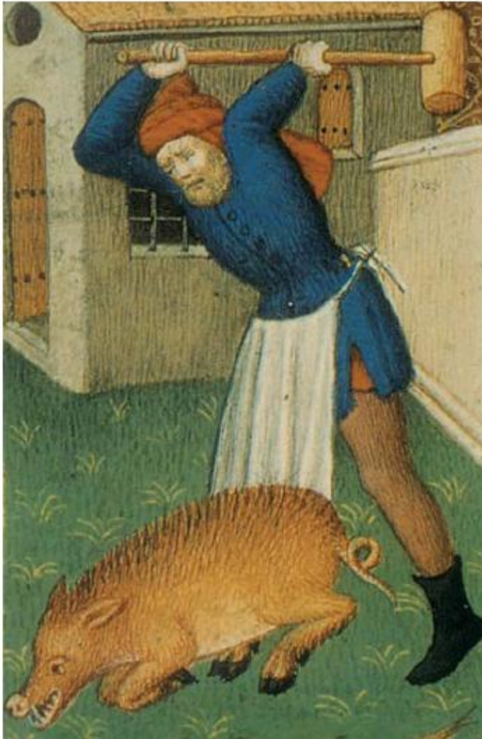
17 Mens en dier: de slacht van een varken.