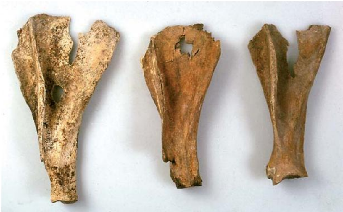
14 Schouderbladen van runderen uit Romeins Nijmegen met sporen van het roken van vlees. Te zien zijn de gaten waar tijdens het roken een haak door geslagen was.

Het zou handig zijn als alle archeozoölogen hun informatie op dezelfde manier zouden vastleggen en bewerken. Van tijd tot tijd klinkt dan ook de roep om standaardisering en uniformering. Maar – terecht – is steeds het antwoord dat dit de dood in de pot is voor de ontwikkeling van het vakgebied, want ontwikkeling komt immers voort uit diversiteit. Wel is van belang dat altijd nauwkeurig wordt aangegeven, welke gegevens beschreven zijn, welke methodiek gebruikt is, welke criteria gehanteerd zijn, et cetera. Om dit proces te stroomlijnen en op een consistente manier uit te voeren is het raadzaam te werken volgens een vast protocol. Zo wordt binnen de Rijksdienst voor het Cultureel Erfgoed en zijn voorgangers gewerkt volgens een 'Laboratorium protocol archeozoölogie – ROB' (Lauwerier 1992; 1997).