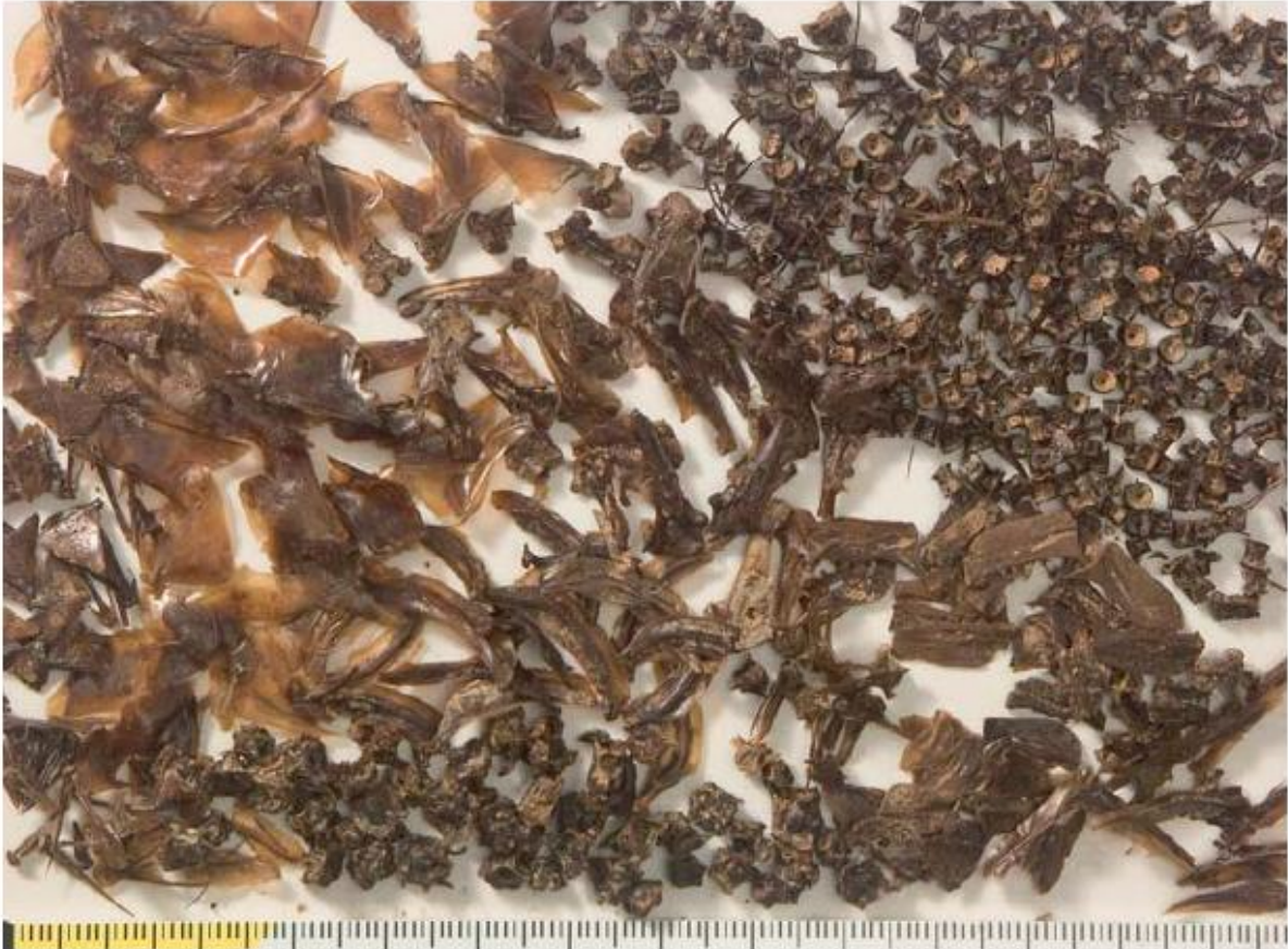
11 Resten van gekaakte haring uit het zestiende-eeuwse 'Colfschip' uit Biddinghuizen.

Soms is het inschakelen van een 'superspecialist' noodzakelijk, bijvoorbeeld als er veel resten van vissen zijn gevonden of bij onderzoek aan insecten of mijten. Hetzelfde geldt voor bijvoorbeeld gebruikssporenanalyse of onderzoek aan DNA of sporenelementen.