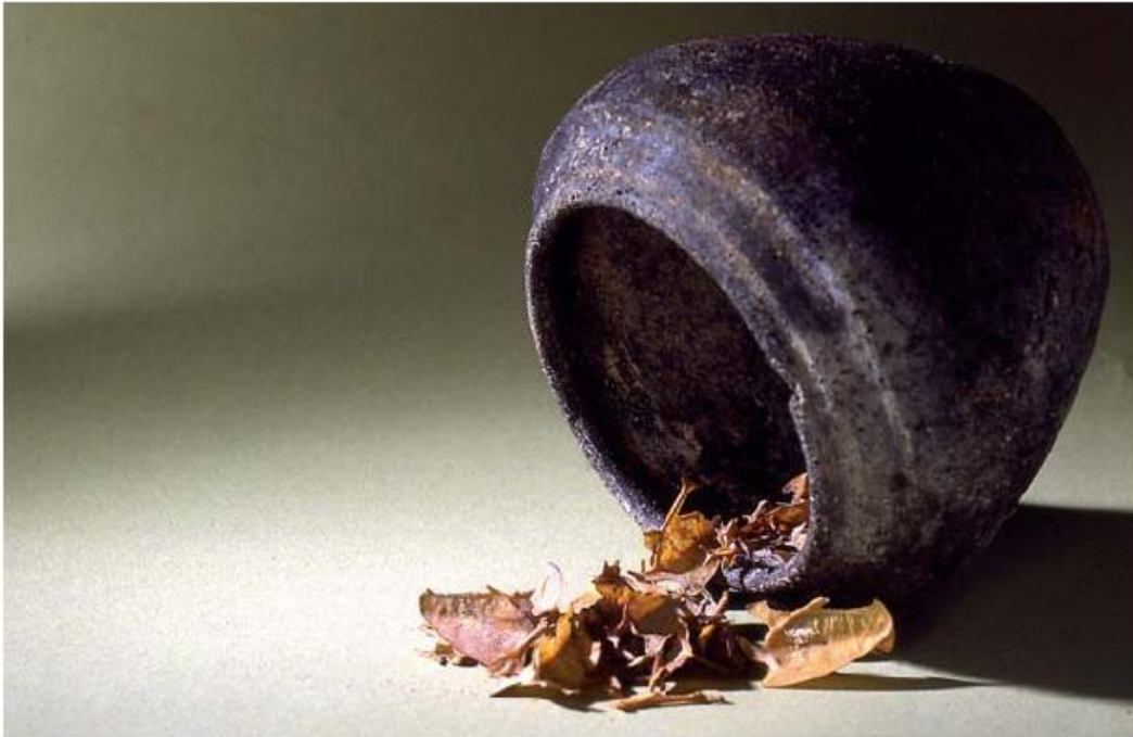
6 Pot met de resten van dertig ingemaakte lijsterborstjes uit Romeins Nijmegen.

Door combinaties van bovengenoemde primaire gegevens en de daarop gebaseerde informatie over dieren worden op een hoger niveau conclusies getrokken over de mens in het verleden: het milieu waarin hij leefde, migratiepatronen, seizoensbewoning of -activiteiten, de voedsleconomie, handel en uitwisseling, sociale differentiatie, rituele gebruiken, ideeën over een hiernamaals, et cetera.