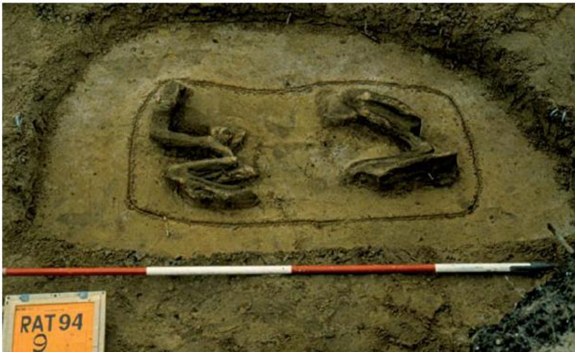
7 Deels vergaan skelet van een edelhert. Een van de terreinoffers die een vierde-eeuwse ijzerproductienederzetting in Raalte markeerden.

Voorals micro-organismen zoals bacteriën en schimmels kunnen bot flink aantasten. Het bot wordt daardoor poreus en kwetsbaar en valt uiteindelijk uit elkaar. Ook wortels van planten kunnen schade aanrichten als ze in het bot dringen en het uit elkaar drukken. De snelheid waarmee deze vormen van degradatie zich afspelen is vooral afhankelijk van het milieu waarin het bot zich bevindt. Zo vindt aantasting door schimmels en planten vooral plaats in een zuurstofrijk milieu. Dit is met name te vinden in goed ontwaterde bodems. Omgekeerd, in een zeer natte omgeving, zoals op veel plaatsen in West-Nederland met een hoge grondwaterspiegel, is biologische aantasting zeer gering.