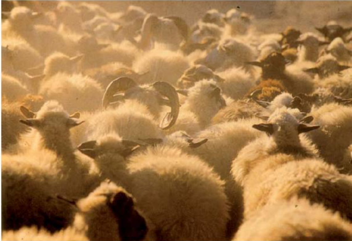
16 Schapen worden gehouden voor de mest, de wol en – na de slacht – voor de vacht en het vlees.

Een programma van eisen begint met terug te kijken naar voorgaand onderzoek om daarmee een verwachting te kunnen formuleren voor het huidige. Raadpleging via www.cultureelerfgoed.nl van BoneInfo, het attenderende systeem voor archeozoölogische informatie, levert binnen een paar minuten een overzicht van voorgaand onderzoek aan bot en andere dierlijke resten.