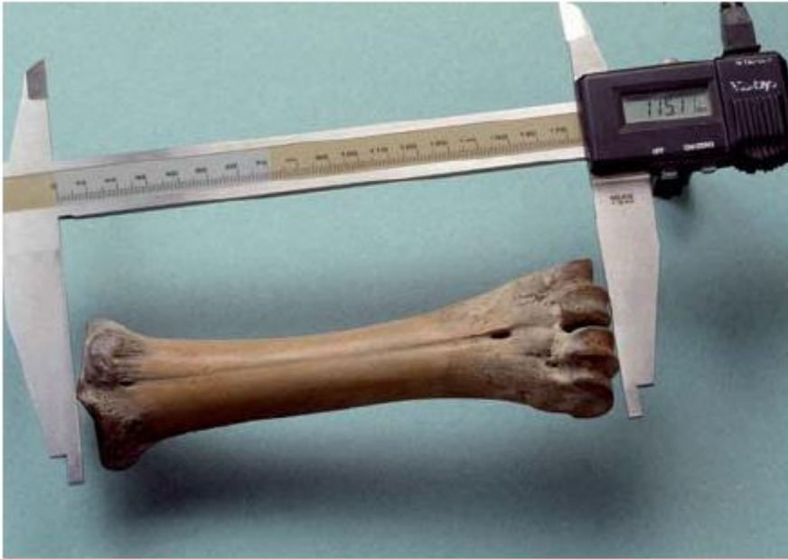
13 Een middenhandsbeen van een rund wordt opgemeten om de grootte van het dier te kunnen schatten.